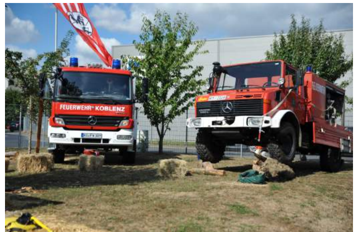
Aus alt mach neu: Das alte TLF 8/20 von 1982 (re.) und das „neue“ Waldbrand-TLF der Einheit 13

Die offizielle Übergabe an die Einheit Arenberg/Immendorf erfolgte im Rahmen des Tages der offenen Tür im August.