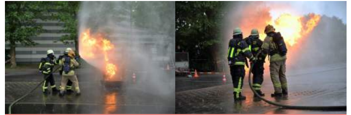
Mit dem feinen Sprühstrahl kann die Flamme „eingefangen“ und „gelenkt“ werden

Neben den Aspekten der Sicherheit und dem Umgang mit dem Hohlstrahlrohr, lag ein besonderer Lernschwerpunkt in der Bekämpfung eines realen Gasbrandes unter umluftunabhängigem Atemschutz mit anschließendem Abschiebern einer solchen Leitung.