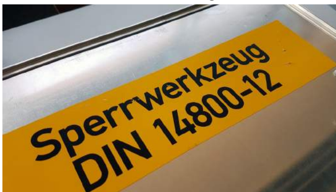
Auch die Einheit Arenberg/Immendorf ist in den letzten Jahren immer häufiger von Türöffnungen betroffen

Im Rahmen einer monatlichen Samstagsübung im Juli trainierte die Einheit Arenberg/Immendorf die Einsatzlage „Türöffnung“. Diese wird zum Beispiel bei der Unterstützung für den Rettungsdienst, der Amtshilfe für die Polizei oder bei verschiedenen Feuerwehreinsätzen notwendig.