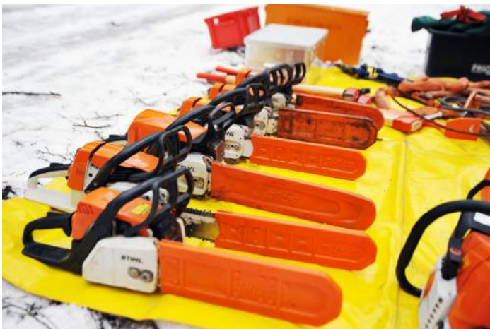
Die Arbeitsgeräte für den Praxisteil stehen schon bereit

Das Schwerpunktthema "Sicheres Arbeiten mit der Motorkettensäge" trainierten die Mitglieder der Einheit Arenberg/Immendorf an einem Wochenende im Februar 2018 in einer zweitägigen Weiterbildung.