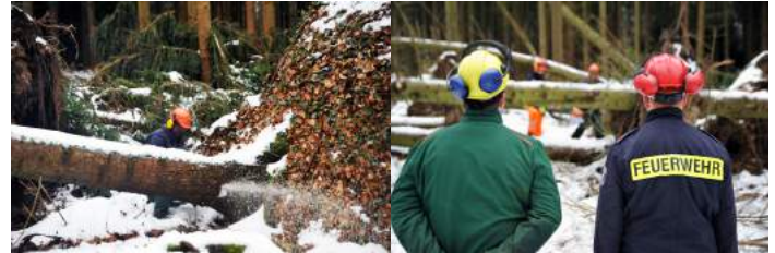
Unter dem wachsamem Blick der Kollegen wurde der sichere Umgang mit den Kettensägen geübt

lagen wie Unfallverhütungsvorschriften, Geräte- und Schneidtechniken besprochen wurden, galt es am Samstag das Gelernte in die Praxis umzusetzen.