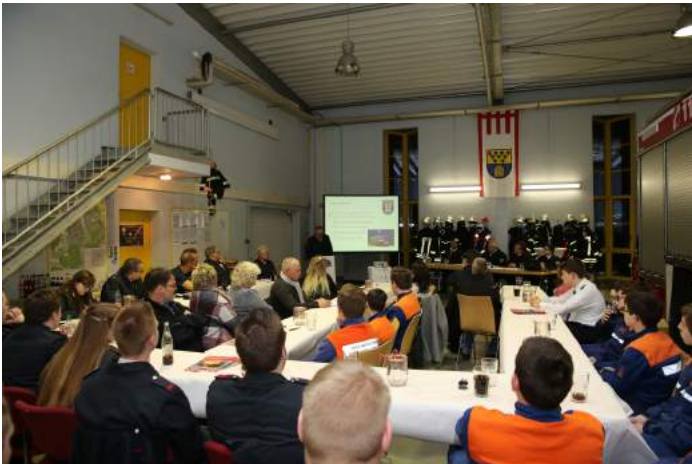
Zahlreiche Mitglieder von Einsatzabteilung, Jugendfeuerwehr und Förderverein kamen zur JHV 2018

Im wahrsten Sinne des Wortes „bis auf den letzten freien Platz“ belegt, war die festlich hergerichtete Fahrzeughalle Anfang März 2018. Grund: Die Einheit Arenberg/Immendorf und der Förderverein hatten aktive Einsatzkräfte, Jugendfeuerwehr, Mitglieder des Fördervereins sowie Vertreter von Berufsfeuerwehr, Stadtfeuerwehrverband Koblenz e. V. und der Politik zur diesjährigen Jahreshauptversammlung geladen.