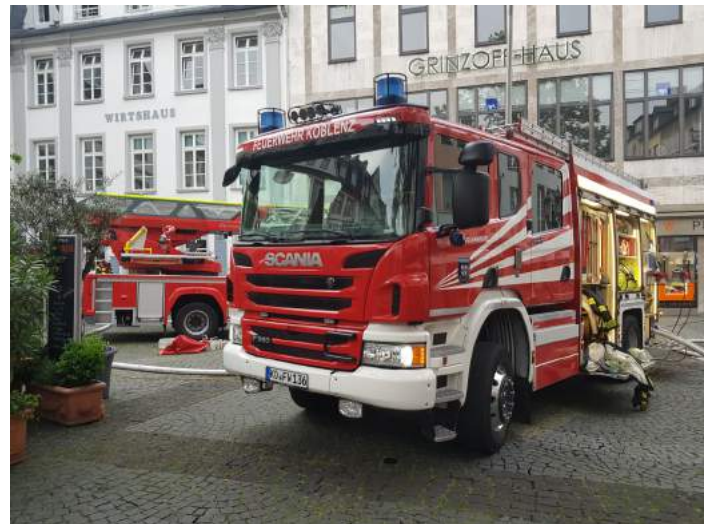
Der Einsatz in der Altstadt von Koblenz gestaltete sich langwierig und sehr personalintensiv

Langwieriger gestaltete sich allerdings der besagte Einsatz in der Altstadt. Hierhin wurden die Besatzungen von HLF und TLF der Einheit Arenberg/Immendorf zur Unterstützung der vor Ort befindlichen Einsatzkräfte nachalarmiert. Gemeinsam mit Kräften der Berufsfeuerwehr sowie den Einheiten Bubenheim und Rübenach