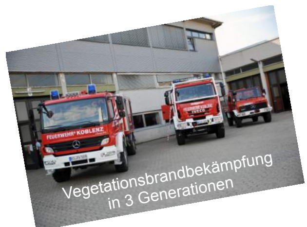
Vegetationsbrandbekämpfung in 3 Generationen

Das neue Fahrzeug ergänzt nun sinnvoll den Fuhrpark der Einheit. Das Fahrzeug verbessert, durch seine größere Mannschaftskabine (sechs statt drei Sitzplätze) und den deutlich größeren Wassertank, sowie der zusätzlichen feuerwehrtechnischen Beladung, erheblich den Einsatzwert. Auch dieses Fahrzeug ist, genau wie das Vorgängermodell auf einem Allrad-Fahrgestell aufgebaut und somit für Einsätze im Gelände bestens gerüstet. Durch die angepasste Motorleistung können nun auch Einsatzstellen in anderen Stadtteilen deutlich schneller erreicht werden.