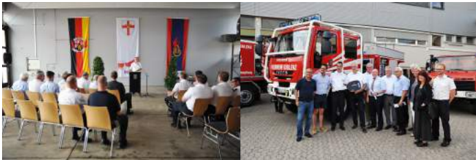
Nach den Grußworten von Amtsleitung und Politik erfolgte die feierliche „Schlüsselübergabe“

Im Sommer 2018 konnte die Feuerwehr Koblenz die, seit längerem geplante, Modernisierung des Fahrzeugfuhrparks im Bereich der Wald- und Flächenbrandbekämpfung abschließen. Bei einer Feierstunde auf dem Gelände der Hauptfeuerwache und im Beisein von zahlreichen Vertretern der Koblenzer Stadtpolitik konnten gleich fünf neue Einsatzfahrzeuge der Feuerwehr Koblenz in Dienst gestellt werden.