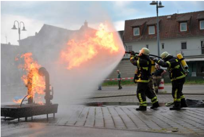
Gasbrandbekämpfung ist absolute Teamarbeit

Atemschutzgeräteträger absolvieren Seminar im hessischen Lollar