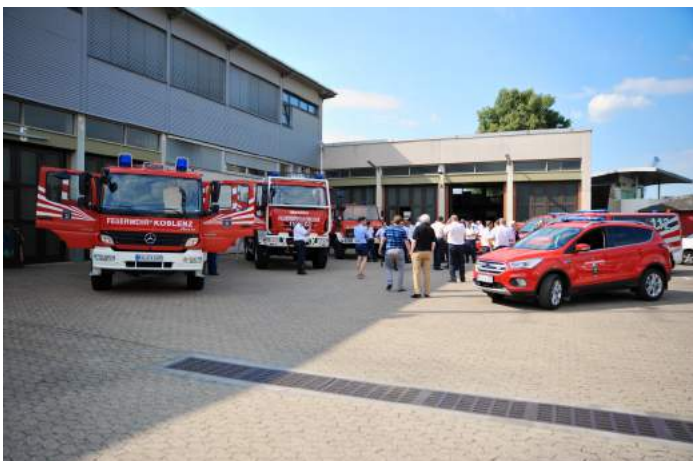
Insgesamt wurden fünf „flammneue“ Fahrzeuge an Berufs- und Freiwillige Feuerwehren übergeben

Neben zwei neuen Kommandowagen (KdoW) für den Führungsdienst der Berufsfeuerwehr und zwei Mannschaftstransportfahrzeugen (MTF) für die Einheiten Ehrenbreitstein und Lay konnte auch ein neues Tanklöschfahrzeug-Wald, welches nun bei der Berufsfeuerwehr stationiert ist, übergeben werden. Das bisher bei der Berufsfeuerwehr eingesetzte Vorgängerfahrzeug wird seit dem bei der, auf Vegetationsbrandbekämpfung spezialisierten, Einheit Arenberg/Immendorf eingesetzt. Hier ersetzt es das TLF 8/20 auf Unimog-Fahrgestell aus dem Jahr 1982.