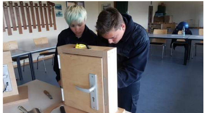
An einem Übungsmodell werden die verschiedenen Techniken und Werkzeuge angewendet

Neben den Aufbaugrundlagen verschiedener Türen und Schließmechanismen, einer Werkzeugkunde, den rechtlichen Grundlagen und Einsatzbeispielen, wurde ein weiterer Schwerpunkt auf die unterschiedlichen Möglichkeiten der „zerstörungsfreien Türöffnung“ gelegt.