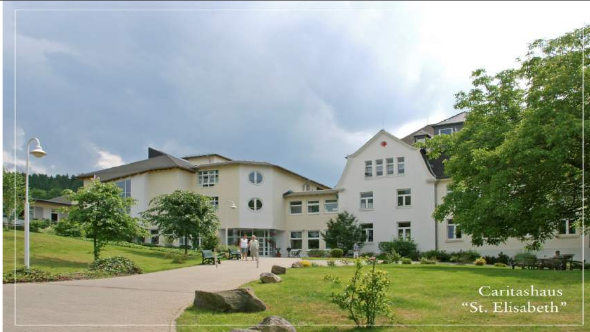
Caritashaus "St. Elisabeth"