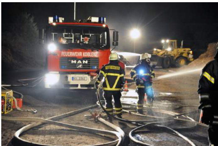
Symbolfoto: Löschmaßnahmen beim Brand auf der Kompostieranlage Niederberg

Der Ausrückebereich der Einheit Arenberg/Immendorf umfasst prinzipiell die Stadtteile Arenberg, Immendorf und Niederberg mit einer Einwohnerzahl von 7.075 Bürginnen und Bürgern (Stand: Juni 2015). Ebenfalls kommt die Einheit 13 bei Schadenslagen im Bereich der Festung Ehrenbreitstein zum Einsatz. Somit umfasst das hauptsächliche Einsatzgebiet eine Fläche von rund 11 Quadratkilometern. Auf Anforderung kommen die Wehrleute aber auch im gesamten Stadtgebiet Koblenz zum Einsatz.